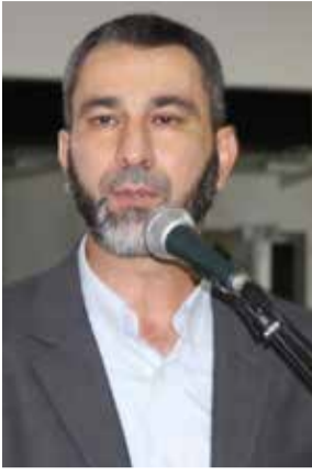
بقلم الشيخ حسام أبو ليل رئيس حزب الوفاء والإصلاح